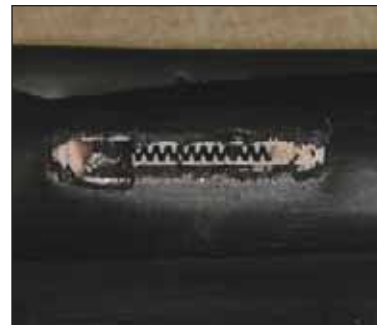
Figura 4. Gotero tapado por óxidos de manganeso.

Es difícil eliminar estas bacterias, pero se pueden controlar inyectando cloro en