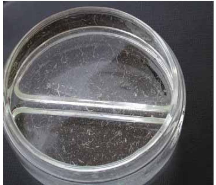
Figura 6. Gusanos arrojados del sistema de riego por goteo. El lavado de las líneas dos veces a la semana resolvió el problema.

Se cree que los huevos o los capullos de los gusanos fueron jalados hacia las líneas de goteo en las elevaciones más altas en el campo cuando se cerraron las válvulas de la zona. Una vez que estaban en las líneas de goteo, los gusanos salieron de los huevos y empezaron a crecer. Los gusanos y otros contaminantes fueron removidos durante los ciclos normales de lavado (cada 2 semanas).